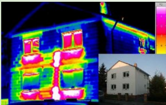
Die Thermografie macht deutlich, dass bei unzureichender Dämmung oder Undichte, die Wärme schnell durch Wände, Fenster, Dach und Boden abfließt. Dies vor dem Hintergrund, dass ca. 80 % des gesamten Energiebedarfs eines Gebäude für die Raumwärme benötigt wird.

In welche Maßnahmen lohnt es sich zu investieren, um Energiekosten deutlich zu verringern?